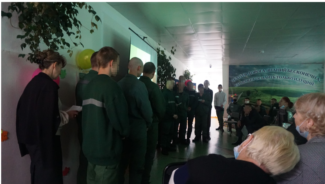
Выступление от учеников от 10-го класса. Поют песню «В глазах озера доброты»