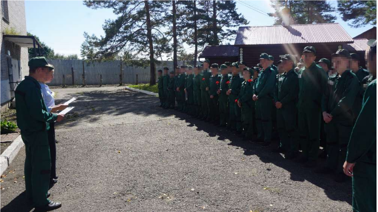
Линейка, посвященная Дню окончания Второй мировой войны

3 сентября 1945 года считается Днем окончания Второй мировой войны, также в этот день отмечают День воинской славы России. В школе Биробиджанской воспитательной колонии была организована торжественная линейка, посвященная Дню окончания Второй мировой войны.