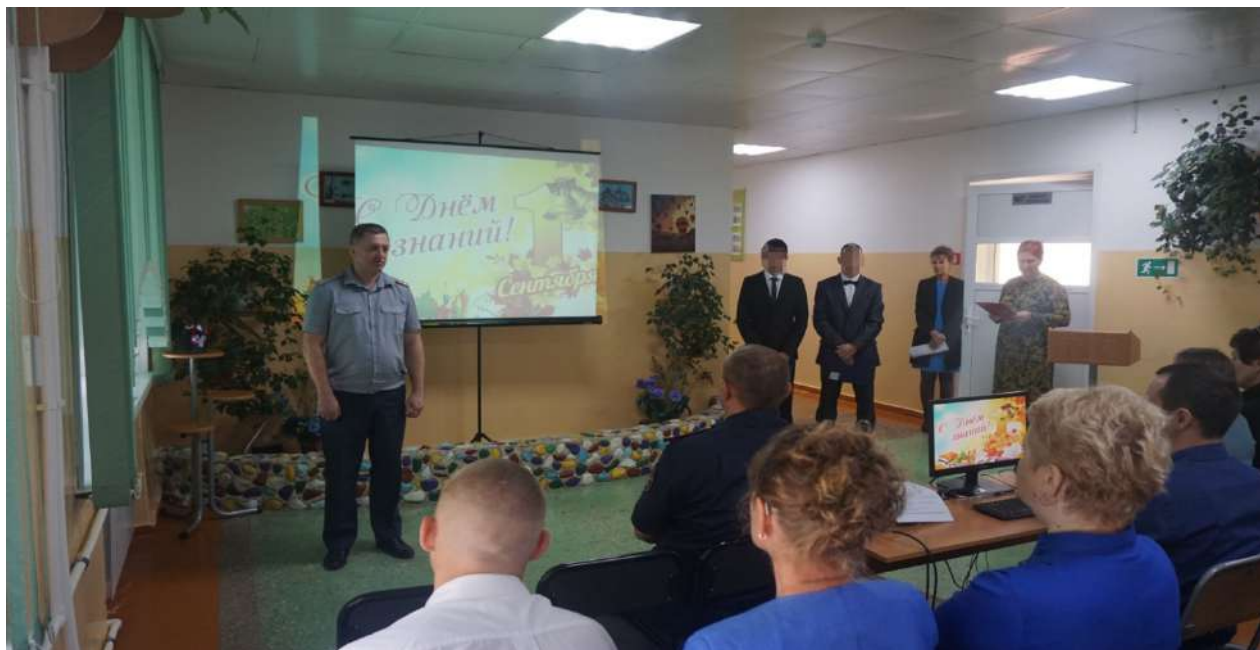
Перед коллективом школы выступает начальник УФСИН России по ЕАО В.Е. Михайленко